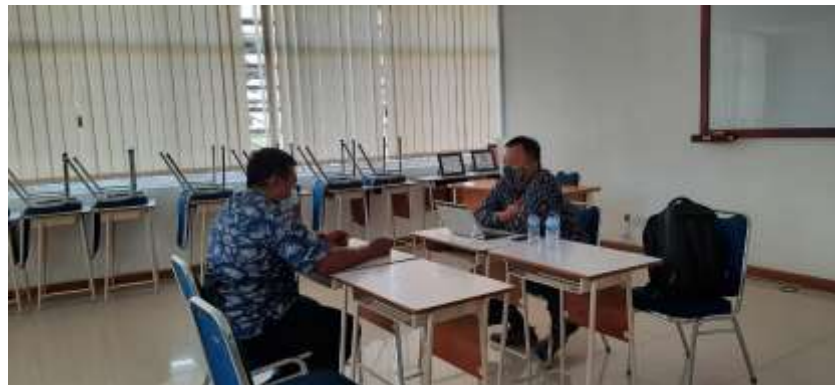
Assessee melakukan konsultasi dengan Asesor