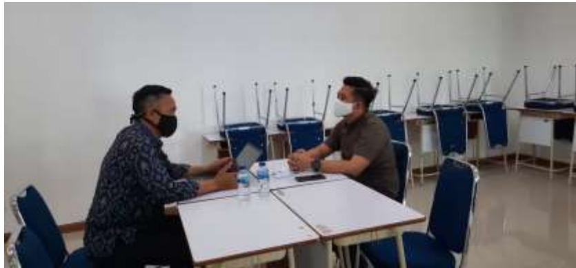
Asesor memberikan klarifikasi hasil penilaian kepada Assessee

Laporan Kegiatan Laporan Kegiatan Pelaksanaan Feedback Hasil Penilaian Potensi dan Kompetensi Calon Dosen Dan Instruktur Politeknik Pariwisata Palembang