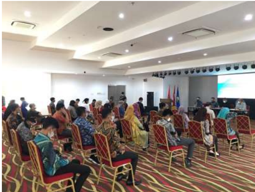
Pembukaan Kegiatan Pelaksanaan Feedback Hasil Penilaian Potensi dan Kompetensi Calon Dosen Dan Instruktur Politeknik Pariwisata Palembang

Para calon Dosen dan Instruktur/ Assessee tersebut dapat mengikuti kegiatan setelah terlebih dahulu melewati protokol kesehatan dalam rangka pencegahan penyebaran Covid-19