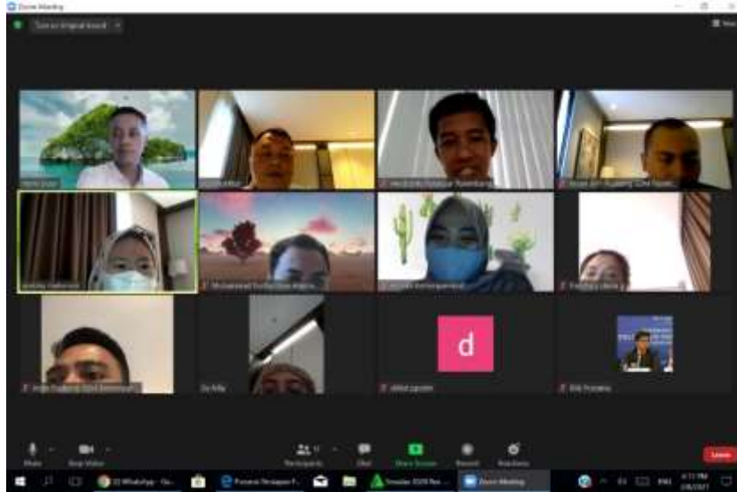
Rapat Persiapan Penyampaian Laporan Penilaian Potensi dan Kompetensi Pegawai Politeknik Pariwisata Palembang

Laporan Kegiatan Laporan Kegiatan Pelaksanaan Feedback Hasil Penilaian Potensi dan Kompetensi Calon Dosen Dan Instruktur Politeknik Pariwisata Palembang