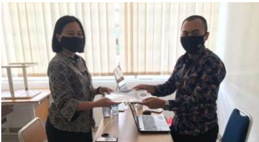
Asesor menyerahkan laporan hasil penilaian potensi dan kompetensi kepada Assessee