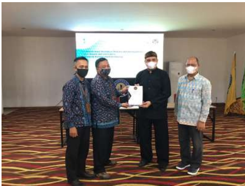
Penyerahan secara simbolis hasil penilaian potensi dan kompetensi

Koordinator Kompetensi Pendidikan dan Pelatihan kepada Direktur Poltekpar Palembang.