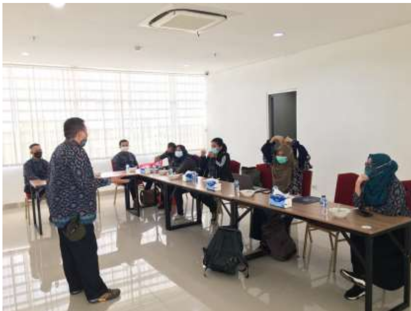
Briefing Tim Asesor sebelum memulai kegiatan yang dipimpin oleh Koordinator Kompetensi Pendidikan dan Pelatihan