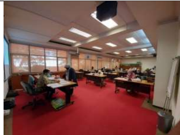
Peserta Profiling sedang mengerjakan tugas tertulis yang diberikan oleh LPTUI