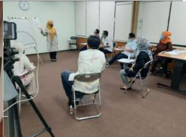
Peserta Profiling sedang melakukan LGD

Jakarta, 15 Oktober 2020 Kepala Pusat Pengembangan SDM Pariwisata dan Ekonomi Kreatif,