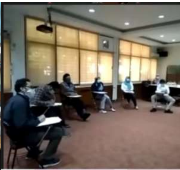
Peserta Profiling sedang melakukan LGD

Jakarta, 12 Oktober 2020 Kepala Pusat Pengembangan SDM Pariwisata dan Ekonomi Kreatif,