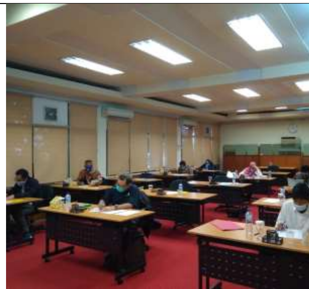
Peserta Profiling sedang mengerjakan tugas tertulis yang diberikan oleh LPTUI