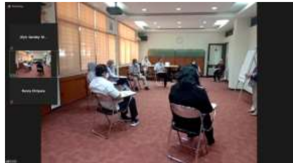
Peserta Profiling sedang melaksanakan LGD