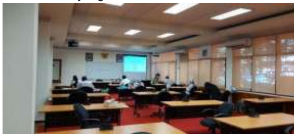
Peserta Profiling sedang mengerjakan tugas tertulis yang diberikan oleh LPTUI

Jakarta, 01 Oktober 2020 Kepala Pusat Pengembangan SDM Pariwisata dan Ekonomi Kreatif,