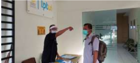
Pengecekan suhu tubuh peserta sebelum memasuki gedung LPTUI