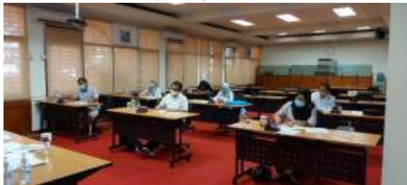
Peserta Profiling sedang mengerjakan tugas tertulis yang diberikan oleh LPTUI