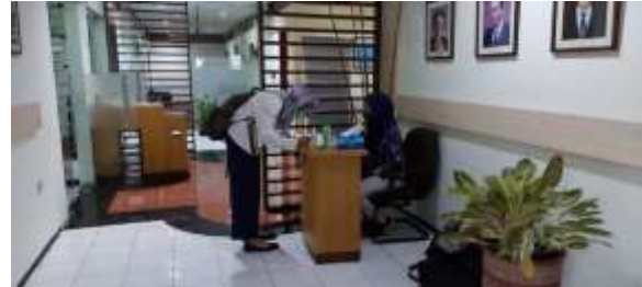
Peserta mengisi daftar hadir